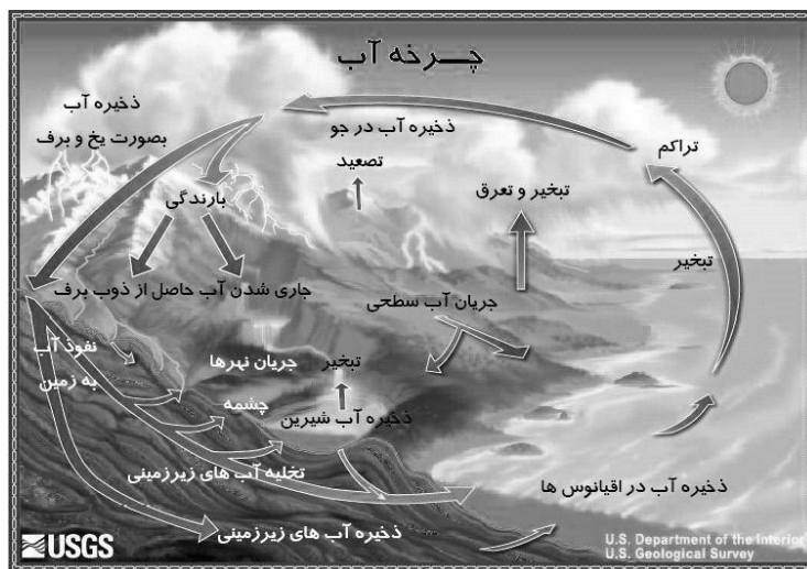
شکل شماره ۱

شکل شماره ۱ نمودار چرخه آب را نشان می‌دهد.